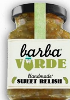
Salsa de Pepinillo dulce