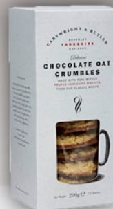
Chocolate Oat Crumbles 200 g