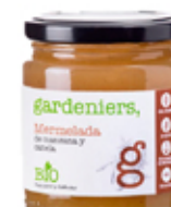
Mermelada de manzana y canela 270 g.