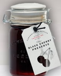
Cereza Negra 200 g