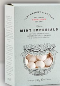
Mint Imperials 190 g