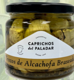
Trozos de Alcachofa Braiseada 250 g