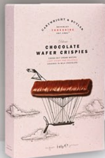
Chocolate Wafer Crispies 140 g