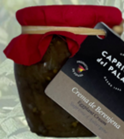
Crema de Berejena 185 g