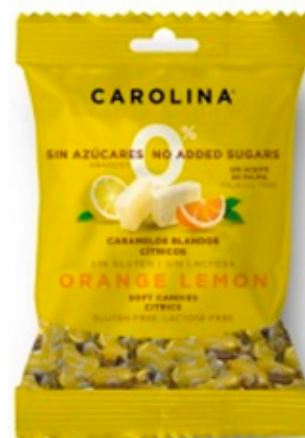
Caramelo Blando Sin Azúcar Naranja y Limón