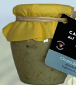
Crema de Alcachofa 200 g