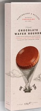
Chocolate Wafer Round 120 g