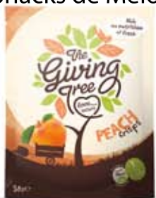
Snacks de Melocotón