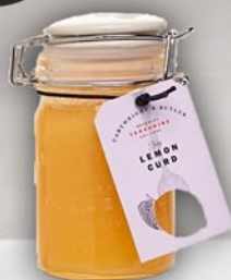
Lemon Curd 200 g