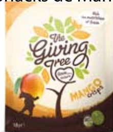
Snacks de Mango