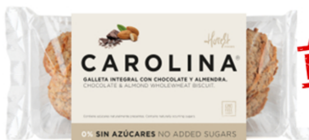
Galleta Sin Azúcares Artesana Integral con Chocolate y Almendra