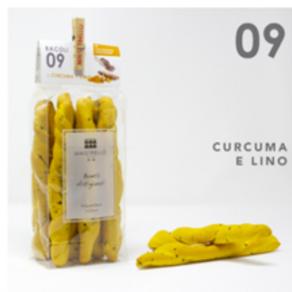
Cúrcuma y Lino