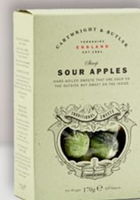
Sour Apples 170 g