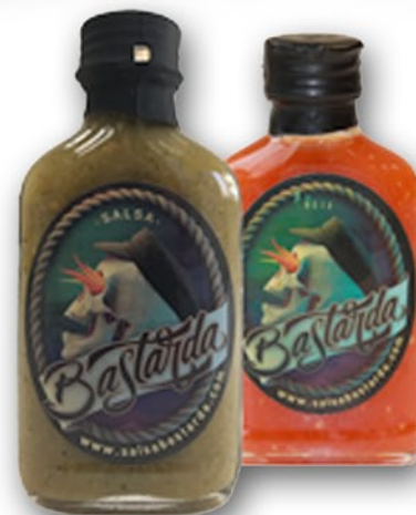
Salsa Bastarda Roja