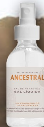
Líquida 200 ml