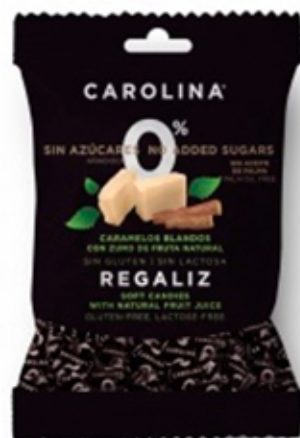
Caramelo Blando Sin Azúcar Regaliz