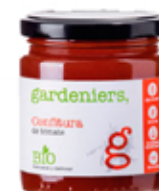
Confitura de tomate 270 g.