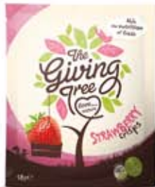
Snacks de Fresa