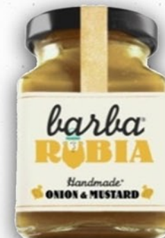
Mostaza con Cebolla dulce