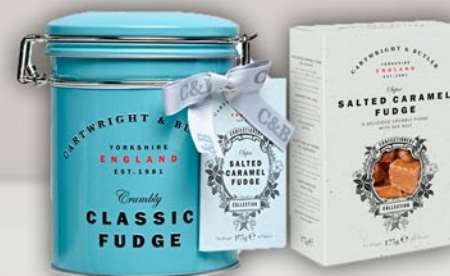
Fudge de Caramelo salado 175 g