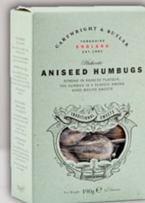
Aniseed humbugs 190 g