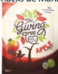
Snacks de Manzana