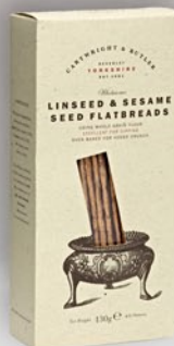
Galleta Salada de Semillas (Sésamo y Linaza) 130 g