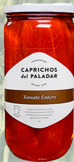
Tomate Entero 720 g