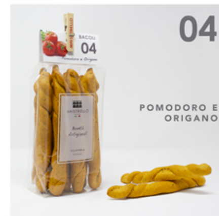
Tomate y Óregano