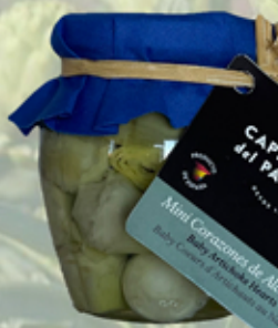
Mini corazones de Alcachofa 200 g