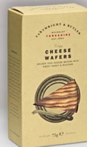
Wafers de Queso 75 g