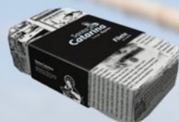
Aceite de Oliva

FORMATO: 120 - 24 ud por caja / 250 ml - 12 ud por caja