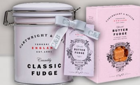
Fudge de Mantequilla 175 g