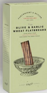
Galleta Salada de Trigo (Oliva y Ajo) 130 g