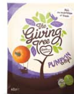
Snacks de Carabaza