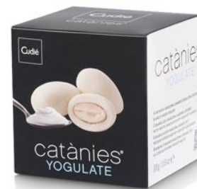
Cubo (100 g)