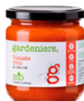
Tomate frito al natural 340g.