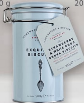
Strawberry & White Choc 200 g