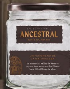
Tarro en Escamas 150 g