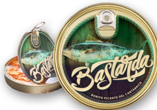
Bonito Picante del Cantábrico