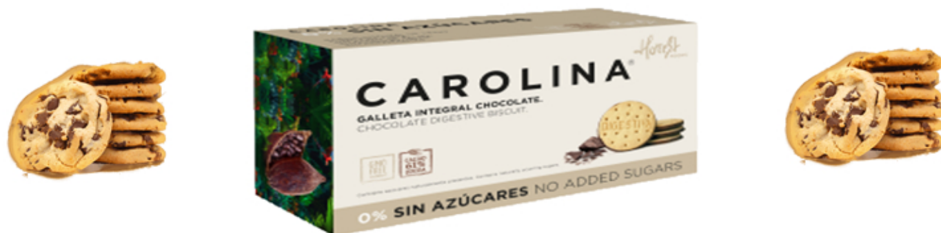
Galleta Sin Azúcares Digestive Integral Chocolate