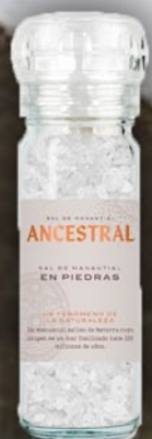
En Piedras 90 g

En Navarra, a 700 metros de altitud, un manantial de montaña de agua salada alimenta más de 500 eras donde la mano experta de nuestro maestro salinero supervisa y pone a nuestro alcance nuestra sal en sus diferentes texturas.