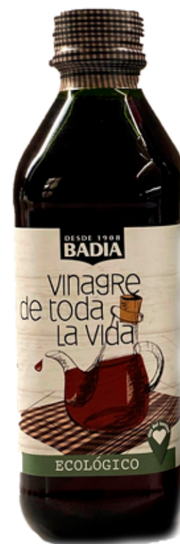
Casero de toda la vida

Vegano, sin gluten y sin pasteurizar. Es el resultado de combinar una agricultura ecológica muy selectiva en origen con un método de fermentación y envejecimiento largo, tal como se ha hecho siempre el vinagre en casa.