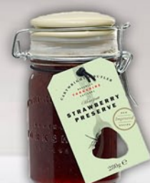
Fresa 200 g