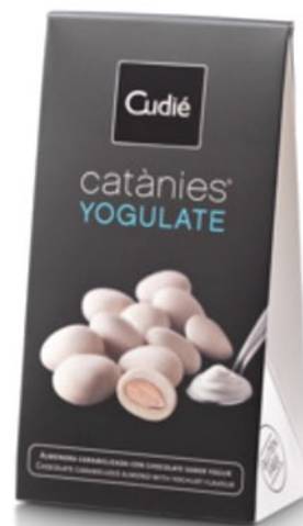
Caja (80 g)

Delicias de Almendra Marcona caramelizada, recubiertas de un praliné de chocolate blanco con sabor a yogurt griego.