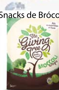
Snacks de Brócoli

El proceso especial de secado por congelación y fritura al vacío del fruto mantiene el 100% de los nutrientes y, permanece intacta. Los estudios incluso indican que la fritura al vacío retiene más nutrientes que la fritura tradicional, mientras que los alimentos secos congelados son ricos en antioxidantes, potasio y fibra.