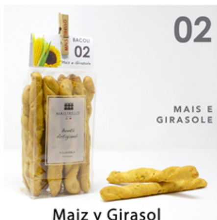
Maiz y Girasol