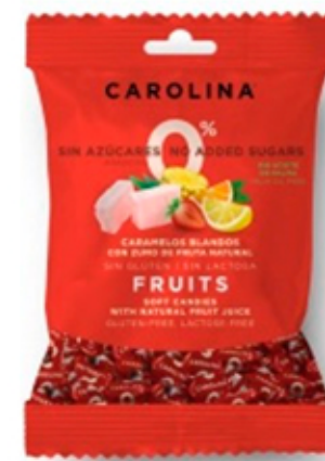
Caramelo Blando Sin Azúcar Frutas