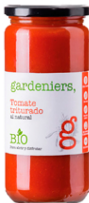
Tomate triturado 680 g.