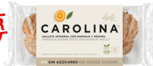
Galleta Sin Azúcares Integral Artesana con Mermelada de Naranja y Sésamo