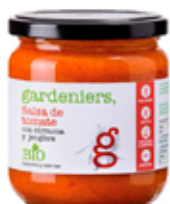
Salsa de tomate con cúrcuma y jengibre 340 g.