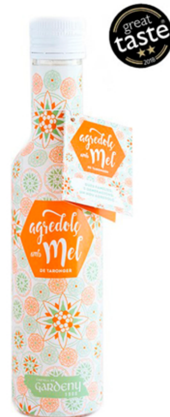
Vinagre Agri dulce con Miel de Naranja 250 ml