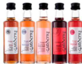
Jerez Vermouth Cava rosé Merlot Cabernet Sauvignon

Un nuevo formato para disfrutar en pequeñas dosis de Castell de Gardeny. Nuestras miniaturas se presentan en dos elegantes estuches que agrupan nuestras variedades de vinagres de vinos tintos y de vinos blancos respectivamente en botellas de 40ml.