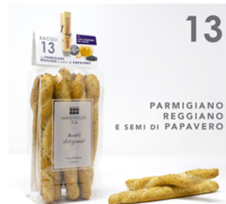
Parmesano y Semillas de Amapola