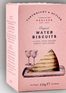
Galleta de Agua 150 g