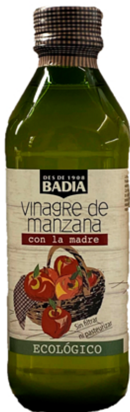
Vinagre de Manzana

Sin filtrar (con la madre del vinagre) y sin pasteurizar. Vinagre vegano, sin gluten y sin sulfitos. Es una apuesta de vinagre natural, 100% ecológico