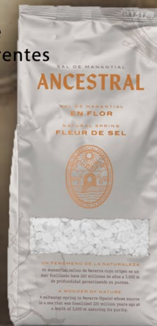
En Flor Bolsa 1,5 Kg