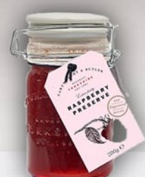
Frambuesa 200 g