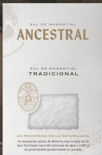
Tradicional 300 g