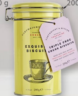
Triple Choc Chunk 200 g