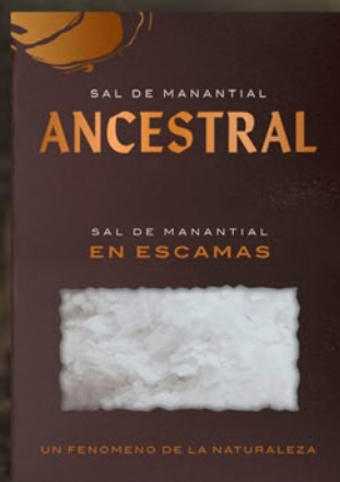
En Escamas 150 g