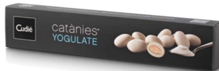
Estuche (250 g)