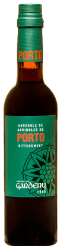
Vinagre Agri dulce de Oporto 375 ml