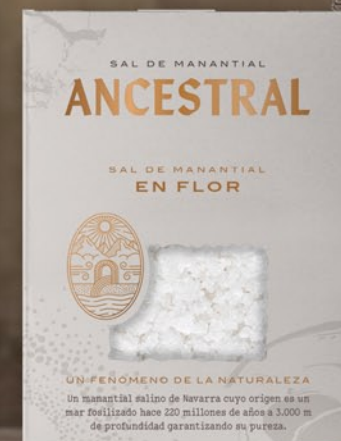
En Flor 150 g

Gracias a dos factores clave, nuestra sal se encuentra completamente libre de cualquier tipo de contaminación y MICROPLÁSTICOS : la ubicación estratégica de nuestro manantial (700m sobre el nivel del mar y alejado de cualquier industria o foco contaminante) y el origen de los depósitos salinos, (formados hace 220 millones de años).